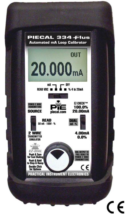
Kompakt und Robust im Holster

Der PIECAL 334Plus stammt aus einer neuen Kalibrator-Generation. Entwickelt für den rauen Alltag. Der Kalibrator ist für mA-Anwendungen in der Werkstatt oder VorOrt einsetzbar. Der PIECAL334Plus kalibriert mit einer Genauigkeit von \pm 0,02\% vom Endwert. Durch die einzuschaltende Hintergrundbeleuchtung lassen sich die Werte auch im Dunkeln gut ablesen. Zur schnelleren Kalibration der Prüflinge können (3) Werte abgespeichert und per Schiebeschalter ausgegeben werden (EZ-CHECK). Der Kalibrator kann 2-Leiter Messumformer simulieren liefert die Schleifenspannung und misst gleichzeitig den Messumformerausgang. Für HART-Anwendungen kann ein 250 Ohm Widerstand zugeschaltet werden. An verrosteten oder losen Anschlussklemmen entstehen Leckströme, der Kalibrator besitzt eine patentierte Loop-Diagnose, der Zustand der gesamten Schleife geht in die Messung mit ein. Mit der Funktionalität wie Speicher, automatische Step- & Rampenfunktion verkürzen Sie Ihre Kalibrierarbeiten. Vier 1,5V austauschbare Batterien versorgen den Kalibrator, optional können 220V AC Netztrafos oder Akkus mit Ladetrafos angeschlossen werden. Zum Schutz ist der Kalibrator in einem Gummi-Holster untergebracht.